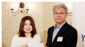
キョエイさんへの奨学金お渡し