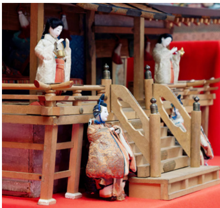
紫宸殿飾り(寛政びな)